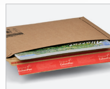
Apertura laterale per un riempimento più veloce