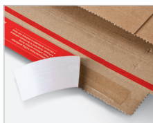
Chiusura autoadesiva ColomPac®