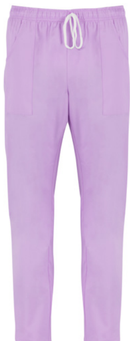
C07 Lilla chiaro